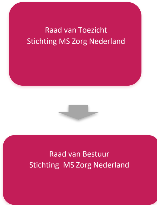
Figuur 2: organisatiemodel Stichting MS Zorg Nederland

De organisatiestructuur van Stichting MS Zorg Nederland is in oktober van 2021 gewijzigd. Ook is er een personele wisseling geweest. Het organisatiemodel van de Stichting MS Zorg Nederland tot oktober 2021 staat in figuur 2 weergegeven.