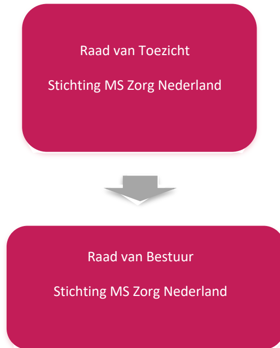
Figuur 2: organisatiemodel Stichting MS Zorg Nederland

De organisatiestructuur van Stichting MS Zorg Nederland is in 2019 en 2020 niet veranderd. Wel heeft er enige personele wisseling plaats gevonden. Het organisatiemodel van de Stichting MS Zorg Nederland is hieronder weergegeven (figuur 2).